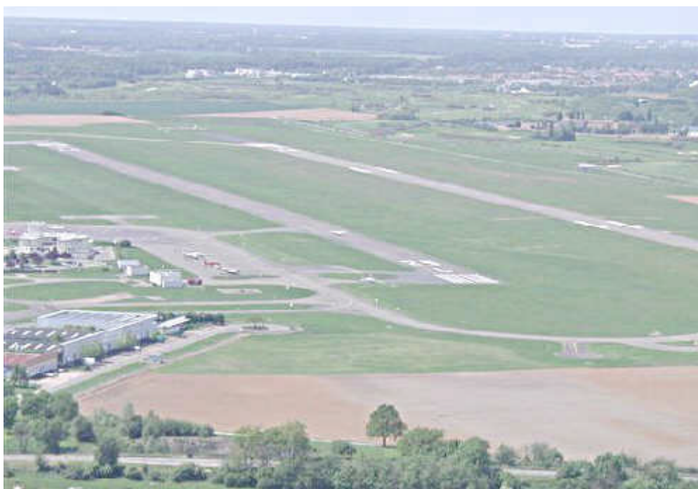
Q F U 25 à LFPN

Si vous êtes débutant, ne croyez pas que commencer dans un tel environnement rend l'apprentissage plus complexe. En effet, le contrôle et ses procédures augmentent de façon importante la sécurité, et rendent en plus la formation aéronautique plus