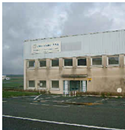
Locaux des IPSA à LFPN