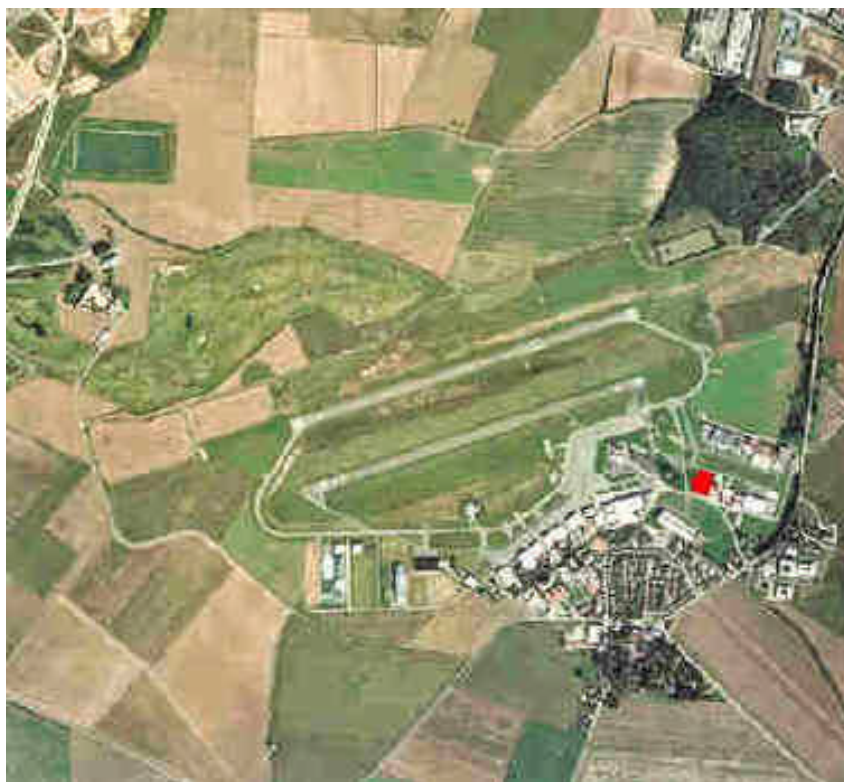
Vue satellite (image IGN) avec implantation des IPSA

Grâce à son infrastructure et grâce à sa proximité de la capitale, l'aérodrome Toussus-le-Noble est le plus grand aéroport d'aviation générale et d'affaires de la région parisienne. Il s'agit d'un aéroport très actif, géré par l'Aéroclub de Paris, accueillant de nombreux aéro-clubs, des professionnels de l'aéronautique (vol à moteur, compagnies d'avions-taxis, stations service etc.), ainsi que des flottes d'entreprises et de sociétés privées.